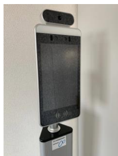
導入された サーモカメラ

URL : https://e-kousei.jp/2022-04-08/557/